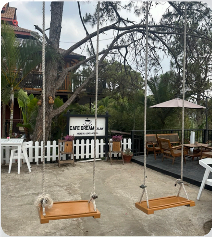
Cafe Dream in Kalaw

Cafe Dream — a cozy little spot nestled in Kalaw, surrounded by pine trees and only 5 5-minute walk away from the iconic Kalaw Tower. Open daily from 9 AM to 7 PM, Cafe Dream offers a variety of coffee and food options to choose from.