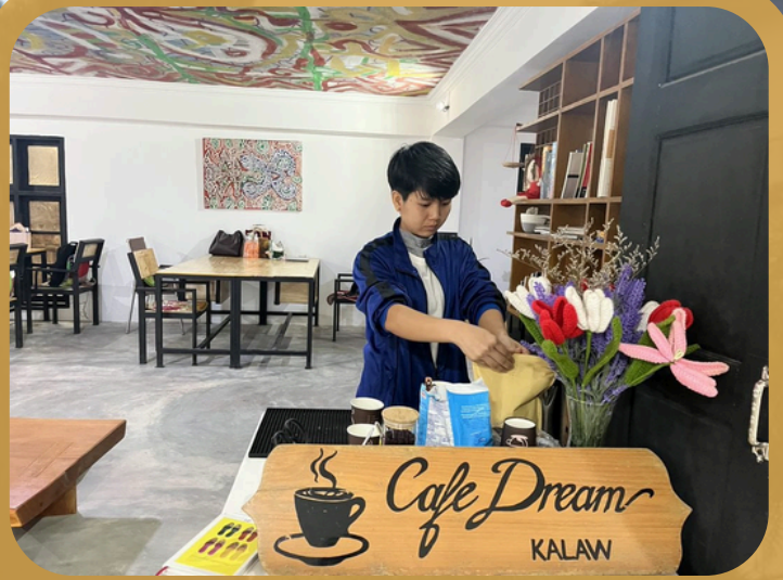
ကလေးမြို့က Cafe Dream

We are also deeply thankful to Cafe Dream for their kind support in providing complimentary coffee to the guests at the opening reception of the "EXISTENCE" art exhibition held at Coming From Kalaw Art Space.